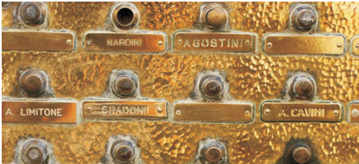
Wohnungsmarkt: Wenn Benachteiligung sichtbar wird

Diskriminierung ist schwer zu beweisen. Doch eine Methode aus den USA macht Ungleichbehandlungen auf dem Wohnungsmarkt sichtbar – wie der Mediendienst Integration berichtet. In Deutschland zeigen viele Studien: Migranten haben bei der Wohnungssuche oft schlechte Karten.